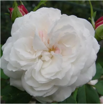
Boule de Neige

crème-wit - historisch, damastroos 105-155 cm sterk, langdurig geurende roos - damaskusroosachtig, parfumachtig François André Robert