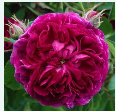
Charles de Mills

roze - historische, damastroos 135-225 cm zeer sterk, van ver te ruiken geurige roos - zoet-kruidig, damastroosachtig