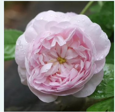
Duchesse De Montebello

paars - historische, damastroos 200-300 cm zeer sterk, tuinvullend geurende roos - rijk, damastroosachtig Jean Laffay