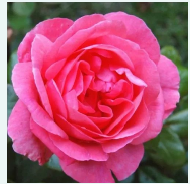
Frau Dr. Schrickler

licht-roze - historisch, oude tuinroos 120-190 cm middelsterke, goed waarneembare geurige roos - zacht zoet aroma Morlet