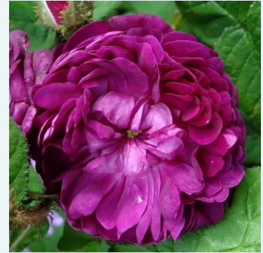
Capitaine John Ingram

roze - historische, centifoliaroos 120-180 cm zeer sterk, van veraf waarneembare geurige roos - klassiek, rozenachtig Duhamel