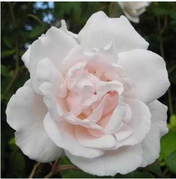
Madame Alfred Carrière

crème-wit - historische - rambler, klimroos - kruiproos 480-720 cm krachtig, langdurig geurende roos - zoetig, muskatachtig Aksel Olsen