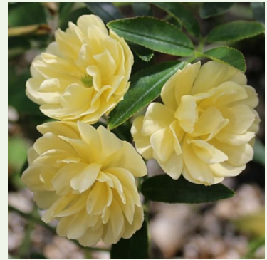
Rosa Banksiae lutea

wit - wilde roos 400-800 cm mild, ingetogen geurende roos - fijn bloemig karakter William Kerr