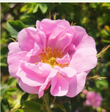
Rosa canina Abbotswood

geel - botanische roos 420-780 cm zeer zwakke, nauwelijks waarneembare geurige roos - klassiek rozenkarakter John Damper Parks