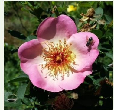
Rosa pimpinellifolia Frühlingsmorgen